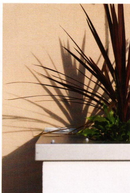
Kassene er beplantet med høye og lavere vekster, her er Acer palmatum 'Garnet' og Lavandula angustifolia. Bunnen er dekket med duk og elvestein.

vokser det omkring 300, kanskje 400 ulike planter. I tillegg kommer det som måtte finnes av ugress. Mangfoldet er i orden hos hagedesigneren.