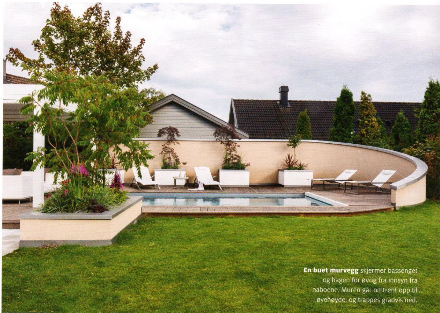
En buet murvegg skjerner bassenget og hagen for øvrig fra innsyn fra naboene. Muren går omtrent opp til øyehøyde, og trappes gradvis ned.