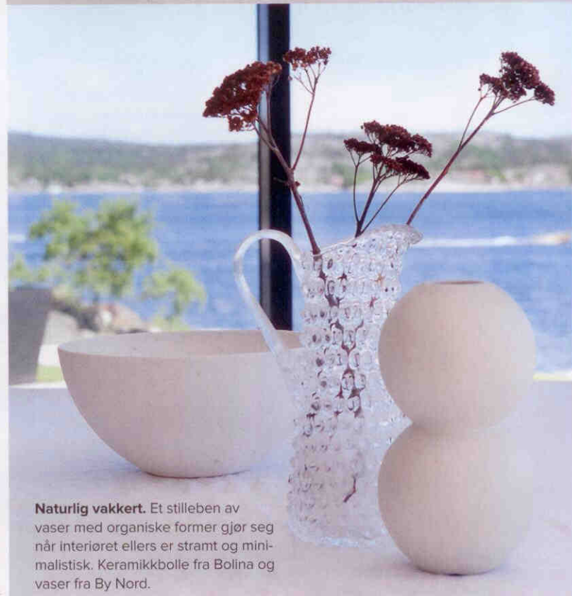
Naturlig vakkert. Et stilleben av vaser med organiske former gjør seg når interiøret ellers er stramt og minimalistisk. Keramikkbolle fra Bollina og vaser fra By Nord.