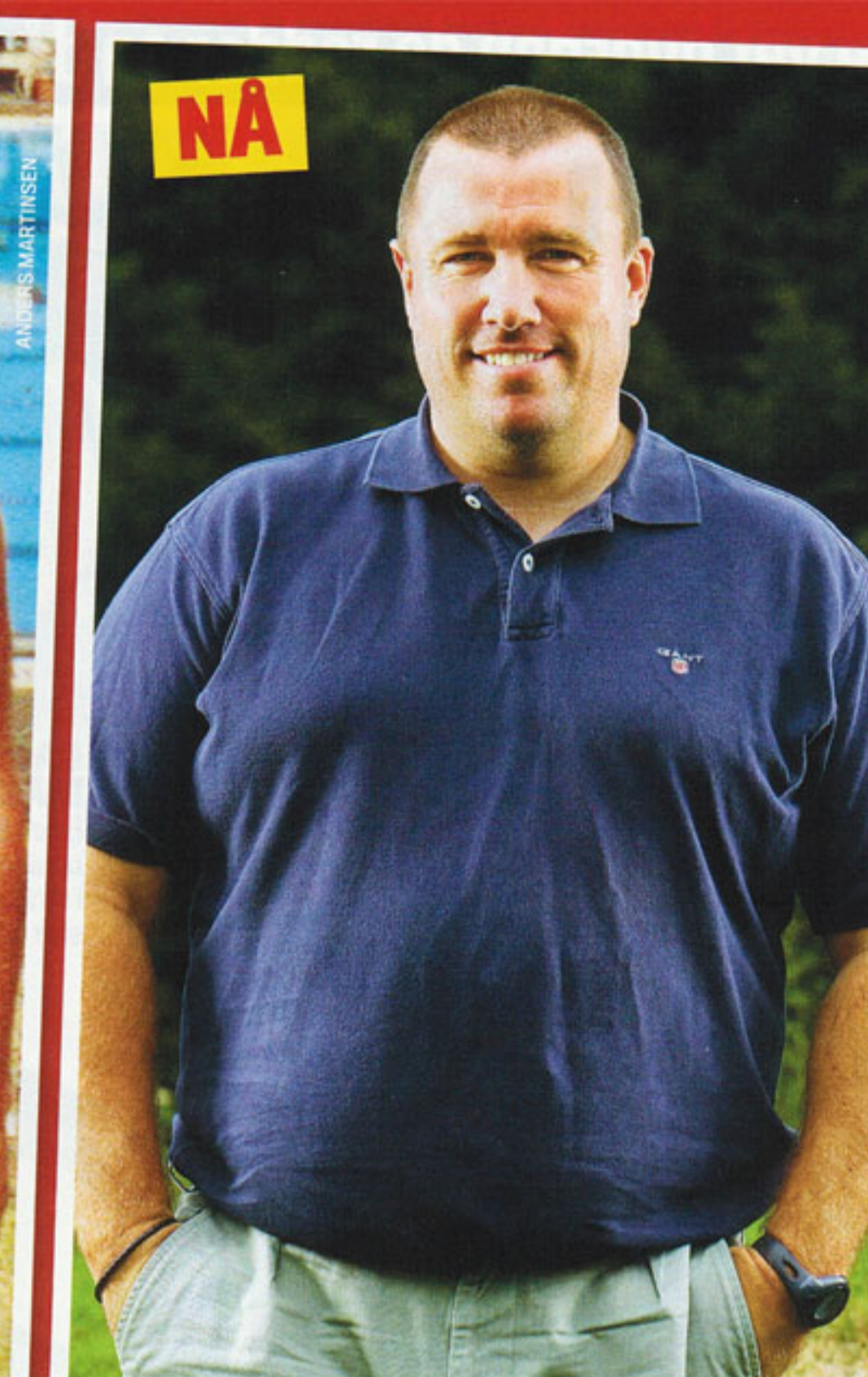
▲ TOPP TRENER: I voksen alder har han konsentrert seg om å trene andre. Selv om han er blitt mer omfangsrik, vet norske fotballfans at han fortsatt er sprek og myk.