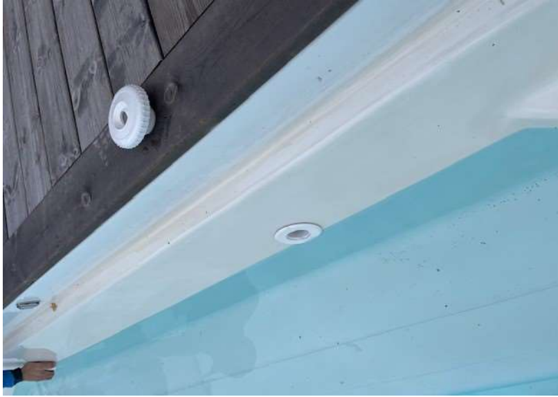
Vannstand under returdyser.