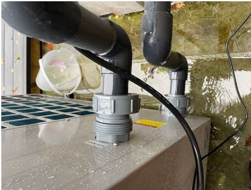
Koblinger varmpumpe løsnes og vannet renner ut