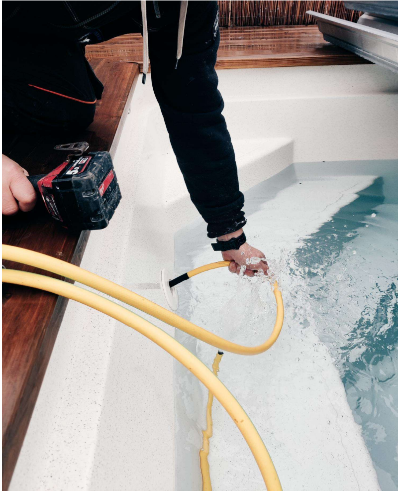
Vann suges ut av returdyser.