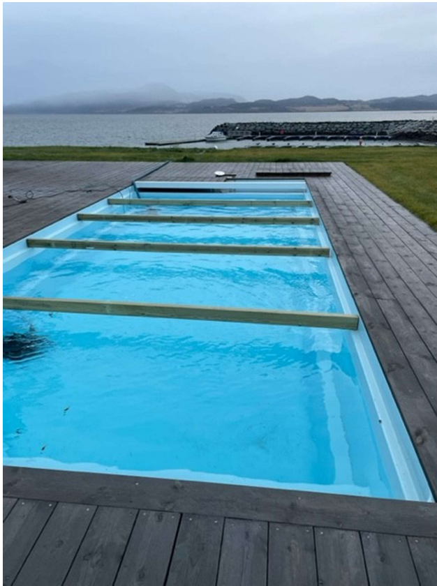
Basseng med avstivere