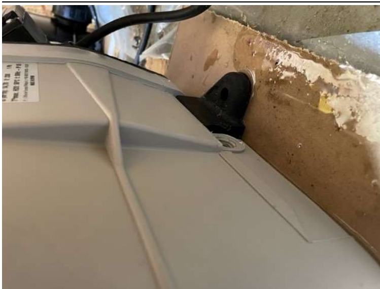
Tappeplugger fjernet fra