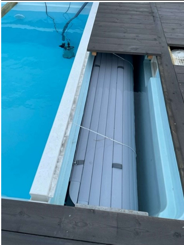
Vannet tappes under dette trekket når man har skillevegg

Besøksadresse: Osloveien 234 1538 MOSS Organisasjonsnr: 916 162 979 MVA