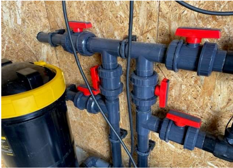
Alle kraner i åpen stilling -