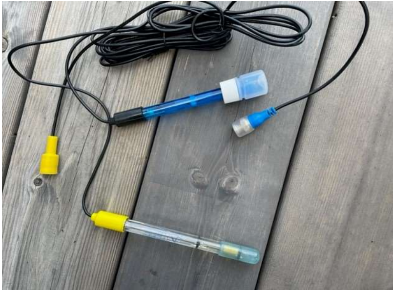
Sonder i beholderne med vann i – oppbevares innendørs i plussgrader