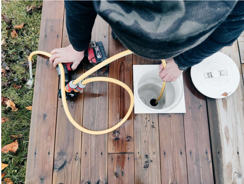
Vann suges ut av skimmer